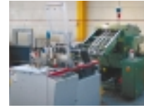
Cheshire 596 - Adressieranlage zur Adressierung von Zeitschriften, Prospekten, Kuverts etc. mit Cheshire-Etiketten. Auch hier ist über Leseköpfe eine automatische Sortierung der Sendungen nach Postbestimmungen realisiert.

oder INK-JET-Direktdruck. Automatische Sortierung der Sendungen nach Infopost- oder Pressepostvorschriften der Deutschen Post AG. Leistung bis zu 12.000 St/h.