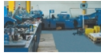
Buhrs 2500 - Einsteck- und Adressierlinie. Einstecken von 6 Beilagen in Zeitschriften und Prospekte. Adressieren der Sendungen per Cheshire-Etiketten

Neben der hier abgebildeten maschinellen Produktion verfügen wir noch über umfangreiche Lager- und Palettenflächen. Hier bewegen wir in